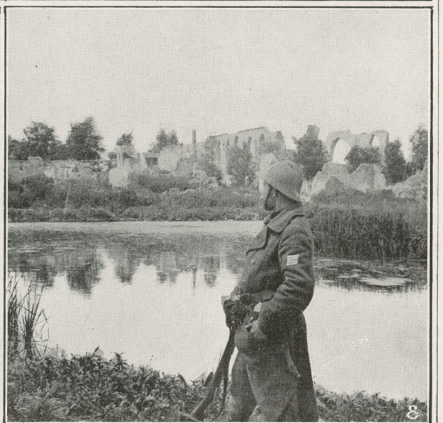
Depuis la fin de 1914, l'armée belge, inébranlable à son poste, monte la garde sur les positions qu'elle a su maintenir lors de la bataille de l'Yser. 1. Un poste avancé au milieu des inondations. 2. Le chemin de circulation vers le vieux fort de Knocke. 3. Une passerelle conduisant aux avant-postes. 4. Un boyau vers Dixmude. 5. Un poste dangereux devant Dixmude. 6. Au confluent de l'Yser et du canal de l'Yser. 7. Observateur d'artillerie aux premières lignes examinant au périscope les effets d'un tir de démolition sur les tranchées allemandes. 8. Sentinelle devant les ruines de Nordschoote.